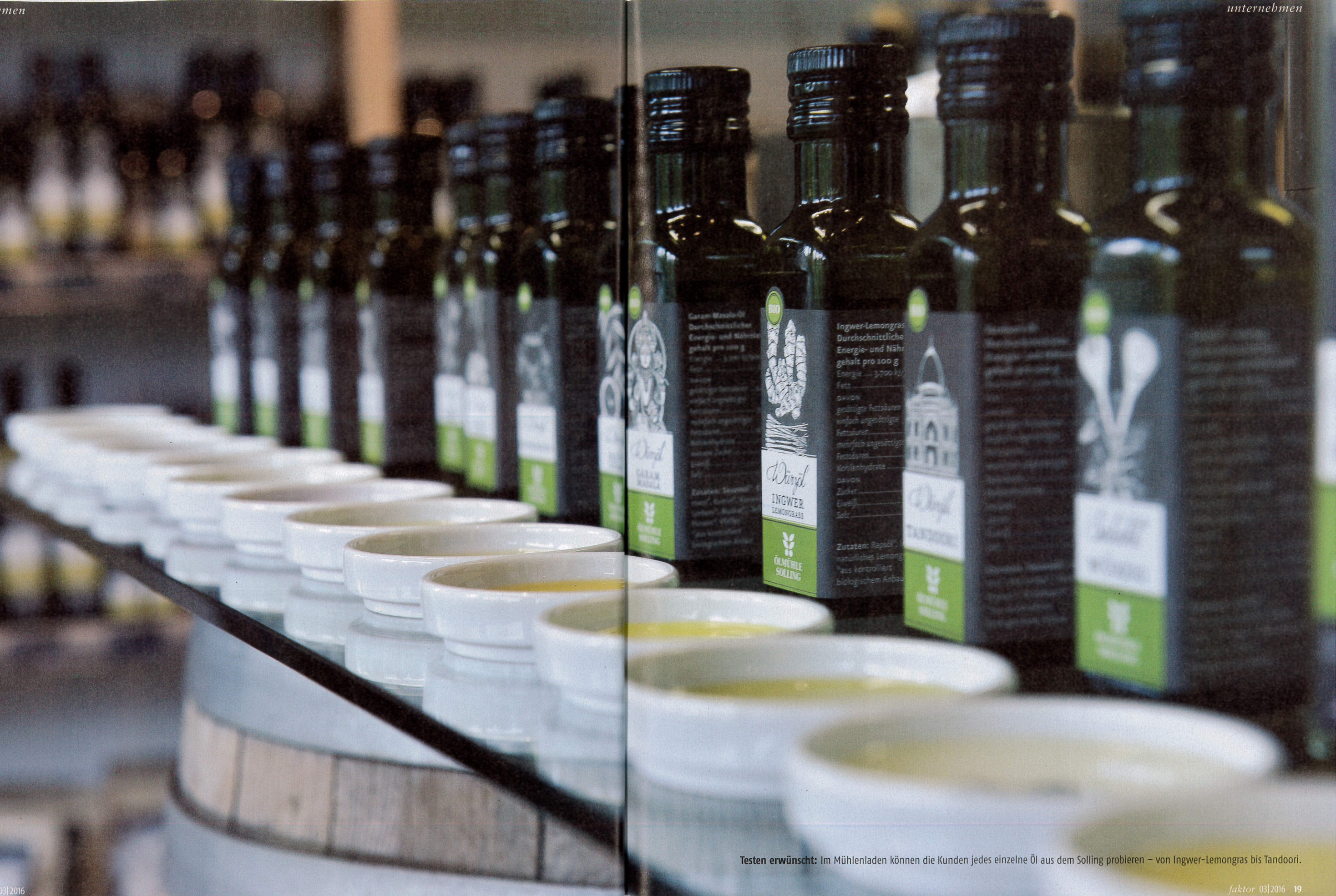
Testen erwünscht: Im Mühlenladen können die Kunden jedes einzelne Öl aus dem Solling probieren – von Ingwer-Lemongras bis Tandoori.