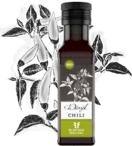
Chili Würzöl FEURIG-SCHARF

In unserem Chili Würzöl treffen feurige Bird Eye-Chilischoten auf kaltgepresstes Rapsöl. Chili macht glücklich: Das in den Schoten enthaltene Capsaicin sorgt auf der Zunge für ein Brandgefühl, das durch den Körper mit der Ausschüttung von Serotonin und anderen Glückshormonen gekontert wird. Wenn der Schmerz nachlässt, verbleibt was? Die Glückshormone.