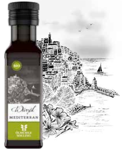
Mediterranes Würzöl WÜRZIGER SÜDEN

In unserem Chili Würzöl treffen feurige Bird Eye-Chilischoten auf kaltgepresstes Rapsöl. Chili macht glücklich: Das in den Schoten enthaltene Capsaicin sorgt auf der Zunge für ein Brandgefühl, das durch den Körper mit der Ausschüttung von Serotonin und anderen Glückshormonen gekontert wird. Wenn der Schmerz nachlässt, verbleibt was? Die Glückshormone.