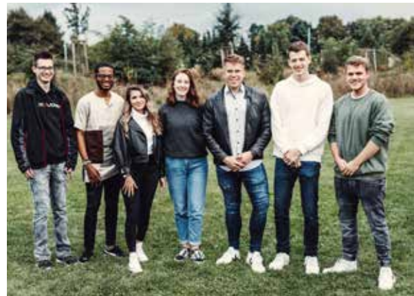
Sieben Azubildende verstärken das Team der Ölmühle Solling und absolvieren derzeit ihre Ausbildung in unterschiedlichen Bereichen.